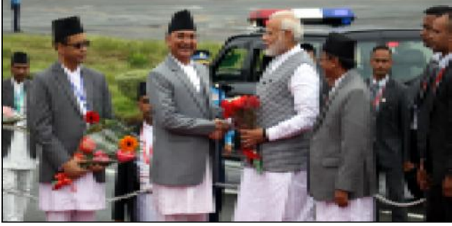
भारतका प्रधानमन्त्री नरेन्द्र मोदीलाई विमानस्थलमा स्वागत गर्दै उपप्रधान तथा रक्षामन्त्री ईश्वर पोखरेल ।