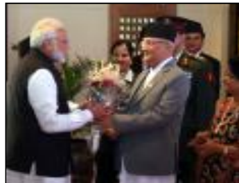
भारतीय समकक्षीलाई स्वागत गर्दै प्रधानमन्त्री ओली ।