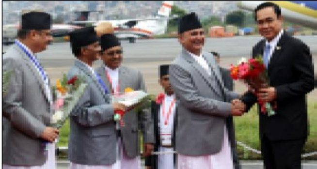
थाइल्याण्डका प्रधानमन्त्री प्रयुत चान ओ चालाई विमानस्थलमा स्वागत गर्दै उपप्रधान तथा रक्षामन्त्री ईश्वर पोखरेल ।