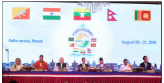
विमस्टेक सम्मेलनको उद्घाटन सत्रमा विमस्टेक सदस्य राष्ट्रहरूका सरकार तथा राष्ट्र प्रमुखहरू ।