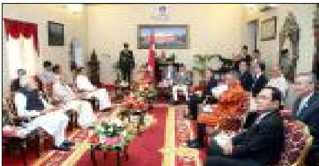
राष्ट्रपति भवन शीतलनीकसमा राष्ट्रपति विद्या भण्डारी र प्रधानमन्त्री केपी शर्मा ओलीसँग सामूहिक केठकमा विमस्टेक सदस्य राष्ट्रहरूक प्रतीतिहरू ।