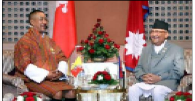
भूटान सरकारका अन्तरिम सल्लाहकार दासो छिरिंगसंग भेटवार्ता गर्दै प्रधानमन्त्री केपी शर्मा ओली ।