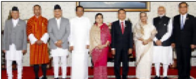
राष्ट्रपति विद्यादेवी भण्डारीसँग राष्ट्रपति भवन शीतल निवासमा विहीवार संयुक्त भेटवार्तापछि सामूहिक तस्वीर ।