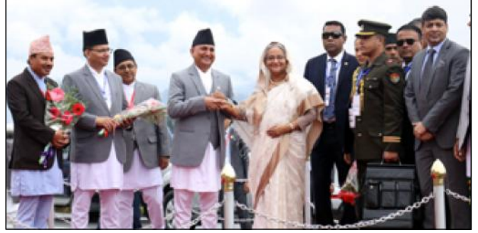
बंगलादेशका प्रधानमन्त्री शेख हसिनालाई स्वागत गर्दै उपप्रधान तथा रक्षामन्त्री ईश्वर पोखरेल ।