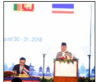
उद्घाटन मन्तव्य व्यक्त गर्दै प्रधानमन्त्री केपी शर्मा ओली ।