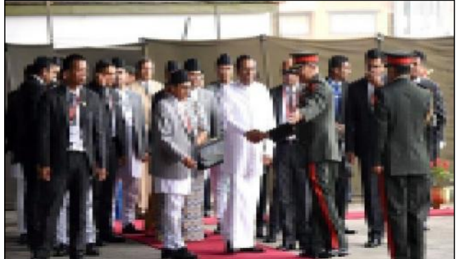
श्रीलंकाका राष्ट्रपति मैत्रीपाला सिरिसेनालाई स्वागत गरिदै ।