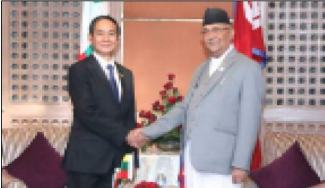
म्यानमारका राष्ट्रपति विन मिन्टसंग भेटवार्ता गर्दै प्रधानमन्त्री केपी शर्मा ओली ।