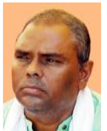
फोरम अध्यक्ष उपेन्द्र यादव

जसको सरकारमा जाने यात्रामा बेक लाग्यो । तर उसकै सहयोगी संघीय समाजवादी फोरम दुई बुद्धि सहमत गरेर सत्तायात्राको स्वार्थ चालिरहेको छ । संविधान संशोधनको नाममा सरकारमा गएको फोरमले अहिलेसम्म त्यस विषयमा चर्चा गर्न पनि छोडेको छ । उनले न त मान्यपत्रबाट बैठकमा यो विषय उठाउन गरेको छ न त पार्टीभित्र नै छलफल थालेको छ । सरकारमा फोरमको सहभागिता सशर्तित छ, किनभने उसले सरकारमा सहभागिताको शीर्षत्व अहिलेसम्म पुट्टि गर्न सकेको छैन ।