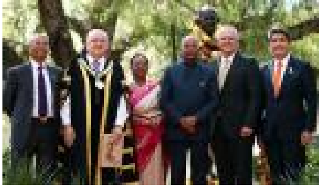
दुई देशीय व्यापारिक सम्मेलनमा सहभागी हुनेछन्। यसअघि राष्ट्रपति कोविन्द भरियतनामको चारदिने भ्रमणमा थिए। सम्बोधन गर्नु साथै त्यहाँका राष्ट्रपतिसँग भेटवार्ता गरेका थिए।

सिड्नी। अस्ट्रेलिया भ्रमणमा रहनुभएका भारतीय राष्ट्रपति रामनाथ कोविन्दसँग अस्ट्रेलियाली प्रधानमन्त्री स्कट मोरिसनले वीहोवार सिड्नीमा शिष्टाचार भेट गरेका छन्।