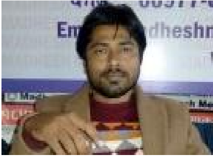
प्रवक्ता, राष्ट्रिय जनता पार्टी नेपाल