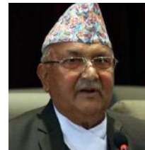
प्रधानमन्त्री केपी शर्मा ओली