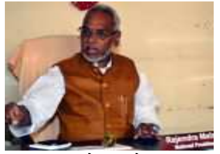
राजेन्द्र महतो अध्यक्ष मण्डलीय नेता राष्ट्रिय जनता पार्टी, नेपाल

० सकाराले ११ वटा जिल्लामा स्थानीय तहको संस्था बढाउनका लागि अधिकृतलाई सङ्केत गरेको