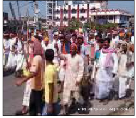
मधेश आन्दोलनको फाइल तस्वीर

मधेशवाणी ट्रेन्क- काठमाडौं । मधेशसँग बारम्बार दूला दलहरूले घोकाको राजनीति गर्दै आएको छ । काँग्रेस, एमाले, माओवादी केन्द्र लगायतका दलहरूले मधेशी दलहरूसँग सम्भोतीता गरेर घोका दिँदै आएका छन् । पहिलो चरणको मतदानमा दुई दिन मात्र बाँकी रहँदा राष्ट्रिय जनता पार्टी नेपालले कडा अभिव्यक्तिहरू दिन थालेका छन् । एकातर्फ मधेशमा चुनावी वातावरणसमेत देखिएको छैन । मधेशमा दूला दलहरूले समेत चुनावी तयारी गर्न डराइरहेका छन् । साथै दोस्रो चरणको चुनाव नहुने सम्भावना बढेको छ । यसैक्रममा राजपा नेपालका नेता राजेन्द्र महताले संविधान संशोधनमा दूला दलको नीयत ठीक नदेखिएको गुनासो गरेका छन् । 'संविधान संशोधनका लागि आवश्यक दुई तिहाई बहुमत पुग्ने लाग्दा राजपाका अचानक भएको विद्रोह संशोधन रोक्न भएको दूला पक्षयन्त्र थियो । महताले यस घटनामा राजपा मात्र नभएर तीन दूला दलका मधेश विरोधी नेताहरू पनि यस पक्षयन्त्रमा सामेल रहेको आरोप लगाए । संविधान संशोधनको विरुद्ध रहेका दलहरू बाँर मधेशी जनतालाई राम्ररी ज्ञात भएको र अब हुने मधेश आन्दोलन यिनै दलहरूको खिलाफ हुनेद्वारा महताले स्पष्ट पारे । महताले भने, 'मधेशी जनतालाई राम्ररी थाहा भई सकेको छ कुन दल संविधान संशोधनको पक्षमा छ र कुन दलले यसको विरोध गरेको छ ।' मधेशी जनताले अबको