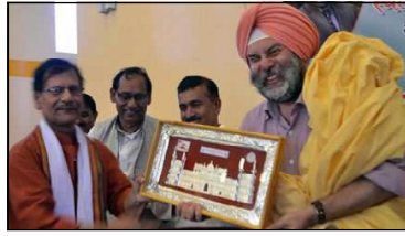
भारतीय राजदूतलाई जनकपुरमा सम्मान गरिएको छ।