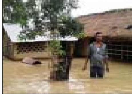
घरआंगनमा बाढी पसेर सबै सामान बर्बाद भएको अवस्था।