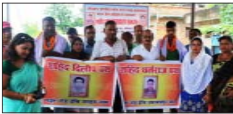
शहीद पथ घोषणा कार्यक्रममा सहभागी राजपा नेपाल पर्सिका नेताकार्यकर्ताहरू।