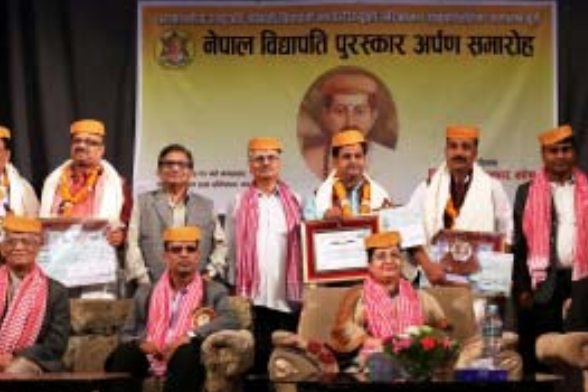
मैथिली साहित्यका आठवटा विद्यापतिको सम्मानना स्थापना भएको विद्यापति पुरस्कार वितरण समारोहमा सहभागीहरू।

काठमाडौं। मैथिली साहित्यका आठवटा विद्यापतिको सम्मानना नेपाल सरकारले वि.सं. २०६८ मा स्थापना गरेको नेपाल विद्यापति पुरस्कार कोषबाट सञ्चालित विभिन्न पाँच विधाका पुरस्कार वितरण गरिएको छ। मंगलबार काठमाडौंमा कोषले आयोजना