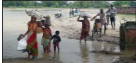
बाढीबाट बच्न सुरक्षित स्थानतर्फ जाँदै सर्वसाधारण।

औद्योगिक क्षेत्रभित्र पस्दा २० मिटर लामो पर्खाल भत्काउनुका साथै उद्योगहरू भित्र पानी पस्दा ठुलो क्षति भएको उद्योगका संचालकहरूले बताएका छन्। यस्तै रूपनी गाउँपालिका २ मा बाढि पस्दा १ सय घर डुबानमा परेका छन्। स्थानीयको