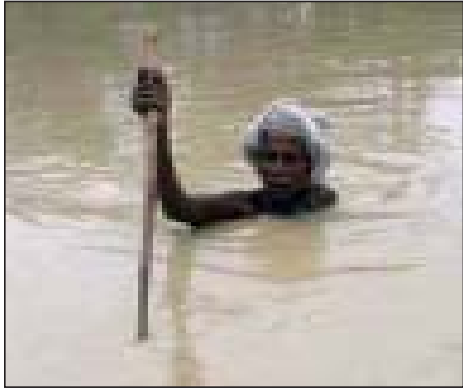
घरआंगनमा बाढी पसेपछि सुरक्षित स्थानतर्फ जाँदै एक वृद्ध।

चन्दनकुमार यादव, राजविराज। बाढीबाट सबभन्दा बढी प्रभावित हुने जिल्ला सप्तरी रहेको छ। वर्षेनी सप्तरीका गाउँहरूमा बाढी आउँदा करोडौंको धनमाल क्षति हुने गरेको छ। तर, राज्यले यसतर्फ कुनै खासै ध्यान दिएको छैन। गत शुक्रबार मध्यरात देखि परेको अखिर बर्षाका कारण खाडो, त्रियुगा, जीता लगायतका नदीको बाढीले नगरपालिकाको २ वटा वडाका साथै आधा दर्जन गाउँ डुबानमा परेका छन्। बाढीबाट राजविराज नगरपालिकाको वडा नं. ९ र १० का साथै मैनाकडेरी, बसर्वाडि, तिलाडि, पौवा, मुसहरनिचा पसरगाही, रायपुर, लौनिया, रूपनी, पकरी, रम्पुरा, मलहनीया लगायतका गाउँ