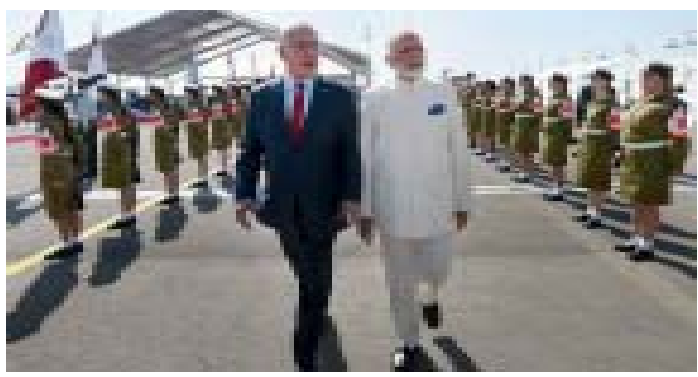
आवश्यक सबै व्यवस्था भएको र यसले भ्रमणको महत्व पृष्टि गर्ने इजरायली अधिकारीले बताएका अन्तर्राष्ट्रिय समाचार

इजरायल। भारतीय प्रधानमन्त्री नरेन्द्र मोदी इजरायलको ऐतिहासिक भ्रमणमा गरेका छन्। मङ्गलबार भारत-इजरायल कूटनीतिक सम्बन्ध स्थापना भएको २५ औं वर्ष पुगेको अवसरमा आयोजित एक समारोहमा सहभागी हुन तेल अभिव पुगेका हुन्। भारत-इजरायल कूटनीतिक सम्बन्ध स्थापनाको २५ औं वर्ष पुगेको अवसरमा हुने प्रधानमन्त्री मोदीको भ्रमण यसअघि सुमधुर रहँदै आएको सम्बन्धलाई थप मजबुत बनाउने विषयमा केन्द्रित रह्यो। भारतीय प्रधानमन्त्री मोदीलाई स्वागत गर्न इजरायली प्रधानमन्त्री बेनजामिन नेतन्याहु इजरायलको अन्तर्राष्ट्रिय विमानस्थल पुगेका थिए। कूटनीतिक शिष्टाचारका लागि इजरायलले भारतीय प्रधानमन्त्री मोदीको सम्मानमा अन्तर्राष्ट्रिय कानुनी परिधिभित्र रहेर