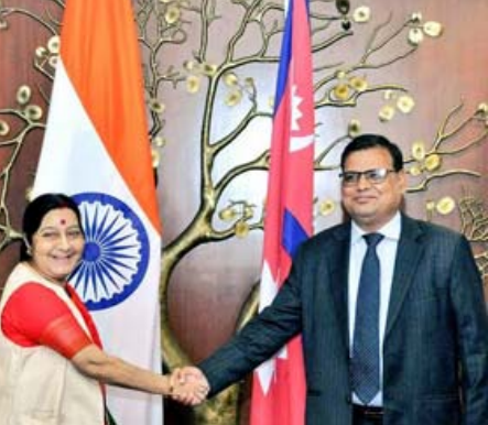
भारत प्रमोदका देवा परराष्ट्रमन्त्री महरा आफ्ना समकक्षी सुष्मा स्वराजलाई भेटवार्ताको क्रममा।

नयाँदिल्ली। भारतका विदेशमन्त्री सुष्मा स्वराजको निमन्त्रणमा भारत भ्रमणमा रहेका उपप्रधान तथा परराष्ट्र मन्त्री कृष्ण बहादुर महराले आफ्ना समकक्षीसंग सोमवार नयाँदिल्लीमा भेटवार्ता गरेका छन्। नेपालमा शेरबहादुर देउवा नेतृत्वको सरकार गठन भएपछि नेपाल र भारतबीच पहिलो पटक उच्चस्तरीय भेटघाट भएको हो। भेटघाटका क्रममा दुवै देशका विदेश मन्त्रीहरूबीच दुईपक्षीय हित र आपसी चासोका विषयमा वृहत रूपमा छलफल भएको हो। साथै उनीहरूले नेपाल र भारतबीच कनेक्टिभिटी तथा विकासका परियोजनाहरूलाई कसरी अगाडि बढाउने विषयमा पनि छलफल भएको भारतका विदेश मन्त्रालयले जनाएको छ। भेटका क्रममा दुवै मन्त्रीहरूले आगामी दिनमा नेपाल र भारतको सम्बन्धलाई सुदृढ पारी दुईपक्षीय सहकार्यमा जोड दिने तथा दुई देशको सम्बन्ध र मित्रतालाई फलप्रभावकारी प्रतिबद्धता जनाए। त्यस क्रममा उपप्रधान तथा परराष्ट्र मन्त्री महराले नेपालमा हालै सम्पन्न भएको दुई चरणको स्थानीय तहको निर्वाचनले संविधान कार्यान्वयनमा सघाउ पुऱ्याउने विश्वास व्यक्त गरे। भारतीय विदेश मन्त्री स्वराजले उपप्रधान तथा परराष्ट्र मन्त्री महराको सम्मानमा रात्रीभोजको पनि आयोजना गरिन्।