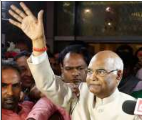
छिमेकी मित्रराष्ट्र भारतका १४औं राष्ट्रपति रामनाथ कोविन्द। विस्तृत समाचार पृष्ठ ७ मा