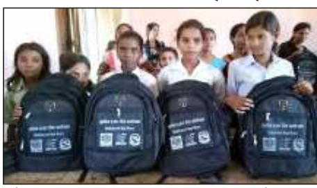
सुनौला हजार दिन आयोजनाअन्तर्गत किशोरीहरूलाई वितरण गरिएको शैक्षिक सामग्री ।

राकेश यादव, रौतहट । रौतहट जिल्लाको गौर नगरपालिका १२ साविक गाउँ विकास समिति मुडुवावाला वार्ड नम्बर १ मा सञ्चालन रहेको सुनौला हजार दिन आयोजनाअन्तर्गत किशोरीहरूलाई एक कार्यक्रमवीच शैक्षिक सामग्री वितरण गरिएको छ ।