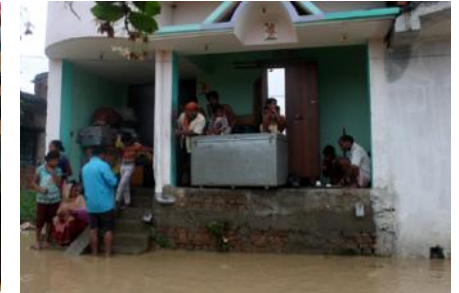
बाढीबाट बच्न सुरक्षित स्थानमा बास बसेका सर्वसाधारण।