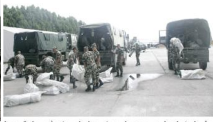
भिन्न अर्न्तगत विमानस्थल, पैदल ब्योक्स्ट बढी प्रभावित स्थानहरू बाघ साम्री तथा अन्य राहत सामग्रीहरू हल्लिँदा लै गरी पठाउँदै।