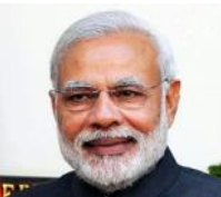
भारतीय प्रधानमन्त्री नरेन्द्र मोदी