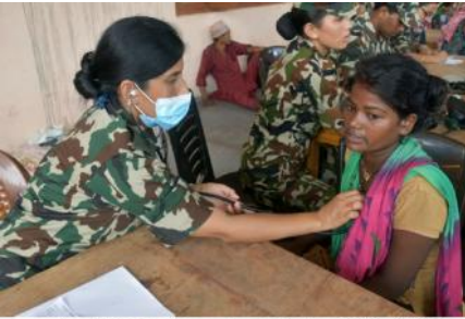
बाढीबाट प्रभावित स्थानीयहरूलाई स्वास्थ्य सेवा प्रदान गर्दै नेपाली सेना।