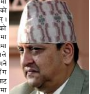
पूर्वजना आनेन्द्र शाह

काठमाडौं । निरन्तरको वर्षासँगै मधेशमा आएको बाढीमा परी लगभग ७० जनाको मृत्यु हुनुका साथै सयौं घाइते भएका छन् । हजारौं परिवार विस्थापित भइसकेको अवस्थामा पुरैजना आनेन्द्र शाहले मधेशमा आएको बाढीबाट जनजनको क्षति भइरहेकोमा दुःख व्यक्त गरेका छन् । साथै उनले बाडीपीडितहरूको सामाना गर्न क्षमताका निमित्त साँगि ईश्वरसँग प्रार्थनासमेत गरेका छन् । पूर्वजका तर्फबाट सोबाबर जारी गरिएको प्रेम विमानमा भनिँएको छ-‘पूर्व श्री ५ महाराजाजिउरमा शाहले वीर विक्रम शाहदेवबाट विगत कसैले नदिनेछे परेको अविलम्ब ब्यापै देशको तराई लगायत विभिन्न भू-भागमा आएको बाडी र पहिरोजनका प्राकृतिक प्रकोपले ठूलो जनजनको क्षति पु-गाएकोमा गम्भीर चिन्ता एवं दुःख व्यक्त गरिबसेको छ ।’