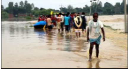
अकस्मिक बैठक बोलाई व्यक्तितगत र संस्थागत रूपमा सिधै राहत वितरण गर्न नपाउने निर्णय गरेको भए पनि अकस्मिक बैठक मन्त्रालय र अर्थ मन्त्रालयसँग समन्वय गरी सरकारी कोषमा अर्को निर्देशन जारी गरे। उद्धार गर्न आकस्मिक बैठक बोलाउन नसके सरकारले कमसेकम आफूले गर्न नसकेको राहत वितरणमा रोक लगाउन भए पनि अकस्मिक बैठक बोलाउन भ्यायो। हुनत सरकारको यस निर्णयको विभिन्न संस्थाहरूले अवज्ञा गरेर भए पनि राहत वितरण जारी राखेका छन्। राहत कोषको रकमबाट मन्त्रीहरूलाई हेलिकप्टरमा भ्रमण गराउँदै गरेको सरकारले मधेशका केही स्थानमा कृहिएको चामल भए पनि बाँड्यो र थप पीडा दियो। बाढीको पानी कम हुँदै जाँदा अत्यन्त बाढीहरू स्थानियले आफूले पहलमा पैदल यात्राका लागि भए पनि खुलाउन थालेका छन्। विस्तारै बाढी

खुल्लु थाले पछि सुरक्षा निकाय पनि आफ्नो नियमित काम र स्थानमा देखिएका छन्। चेकपोस्टहरू फेरी सकृय भएका छन्। सदरमुकामहरूमा जनजिन सामान्य बस्तो देखिए पनि डैरेजसो ठाउँमा राहतको आवश्यकता टड्कारो छ। सरकार "न करेगो न करने देगो"को मन्तव्यसिमा छ। बाढी कम हुँदै गए पनि फैलिन सकेको रोग र महामारी तर्फ संरोक्षवाला निकायहरूले सचेत गराएका छन्। कतिपय स्थानिय रेडियोहरूले रोग र महामारीबाट बच्न सन्देश प्रकाश गरिरहेका छन्, तर स्वास्थ्य मन्त्रीको हेलिकप्टर भ्रमणका वावजुद पनि सरकारी निकाय सम्भावित महामारी र रोगबाट बचाउन तयारी अवस्थामा देखिँदैन। केही गरी महामारी फैलीहालेमा उद्धारमा जस्तै सरकारको रैब्या रहेमा दुर्लो जनधनको क्षति हुन सक्छ। अर्को तर्फ बाढीले बेटीलाई पहिरोको क्षतिको कारण मधेशमा भूकम्पको स्थिति समेत आउन सक्छ। मधेशमा बाढीको रूपमा आएको विपत्तिसमा सरकार र सुरक्षा निकायको व्यवहारले केही गम्भिर प्रश्नहरू खडा गरेको छ। भूकम्प आउँदा केही मिनेट भित्रै स्वतःस्फुर्त रूपमा उद्धारका लागि सकृय भएको सुरक्षा निकाय मधेशमा बाढी आउँदा किन सकृय भएनन्। प्रधानमन्त्रीको निर्देशनका वावजुद पनि सुरक्षा निकाय किन उद्धारमा खटिएनन्।