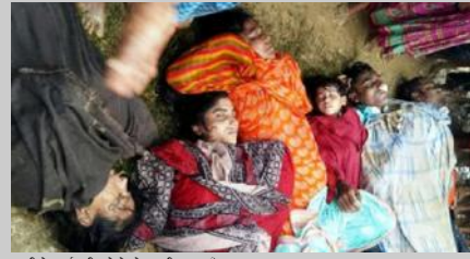
बाढीले गर्भवती बोकेको गाडी बगाउँदा मृत्युकारण ।