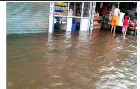
पसलहरूमा पसेका बाढी।