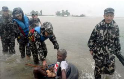
बाढीमा फसेका वृद्धलाई उद्धार गरी सुरक्षित स्थानतर्फ लैजाँदै सुरक्षाकर्मी।