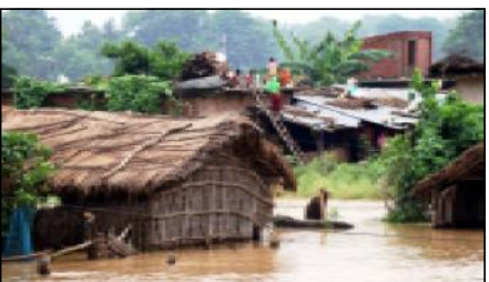
गर्छ। नेपालमा भने विपदको समयमा नेपाली सेनाले आपतकालिन अवस्थामा नैतुल्य लिने गरेको छ। देशमा आएका विभिन्न विपत्तमा नेपाली सेनाले आफ्नो सम्पूर्ण साधनस्रोत र जनशक्ति प्रयोग गरेर विपदमा परेकालाई उद्धार गरेको प्रसस्ती उदाहरण छन्। तर यस पटक विगत शनिवार अर्थात् २७ आषाढ देखि मधेशका जिल्लामा आएको विपत्त बाढीको विपत्तीमा थप सक्रियताको खाँचो देखियो।

गर्न सकिन्थ्यो तर नेपालमा मौसम पूर्वानुमान शाखाले पहिले सचेत गराउने चलन नै छैन, गराइहाले पनि सरकारले एक कानबाट सुनेर अर्को कानबाट उडाउँछ। अर्को तर्फ यस पटकको बाढीमा सुरक्षा निकायले उद्धार गर्ने कुरा त परै जाओस अधिपट्टि आम मधेशीलाई खान