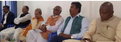
राजपा नेपालका अध्यक्षमण्डलीय नेताहरु ।