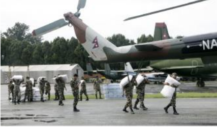
भिन्न अर्न्तगत विमानस्थल बढी प्रभावित स्थानहरू बाघ साम्री तथा अन्य राहत सामग्रीहरू हल्लिँदा लै गरी पठाउँदै।