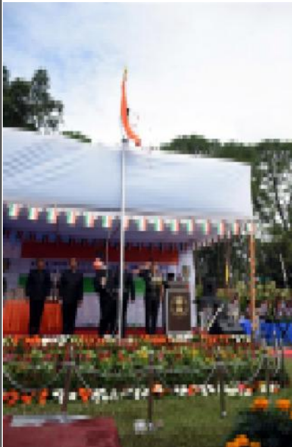
छिमेकी विपन्न राष्ट्र भारतको ७१औं स्वतन्त्रता दिवसको अवसरमा काठमाडौंस्थित मंगलभार भारतीय राजदूतावासमा आयोजित समारोहमा भारतको राष्ट्रिय फुटबल फरारदेई राजकृत मणिषासहित पुर्. विस्तृत समाचार अतिम पृष्ठमा ।