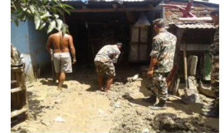
बाढीबाट घर भित्र परेकै खानुवा तथा हिल्लो हटाउँदै बस्न योग्य बनाउँदै नेपाली सेना।