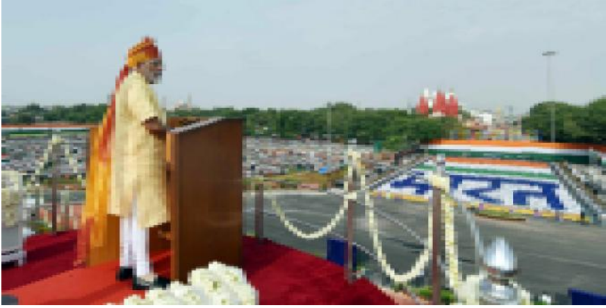
भारतको ७१औं स्वतन्त्रता दिवसको अवसरमा नयाँदिल्लीको लालकिल्लामा आयोजित समारोहमा सम्बोधन गर्दै भारतीय प्रधानमन्त्री नरेन्द्र मोदी ।

नयाँ दिल्ली (भारत) । भारतले ७१औं स्वतन्त्रता दिवस मनाएको छ । भारतको ७१ औं स्वतन्त्रता दिवसको अवसरमा नयाँ दिल्लीको लाल किल्लामा भारतीय प्रधानमन्त्री नरेन्द्र मोदीले सम्बोधन गरेका छन् । उनले 'गोली र गाली' बाट कश्मीरको समस्या समाधान नहुने बताएका छन् । उनले पृथकतावादीहरूले कश्मीरमा 'पड्डयन्त्र रचिरहेको' बताए । प्रधानमन्त्रीले धर्मका नाममा हिंसा गराउने कतिपय समूहलाई सम्बोधनमा कटाक्ष गरे । उनले भने, जातिवाद र साम्प्रदायिक हिंसा मच्चाउनु राष्ट्रको उत्थानमा समस्या हुने बताए । उनले मिलेर कश्मीरमा देखिएका समस्याको समाधान गर्नुपर्ने पनि बताए । तर आरोप वा हतियारको भरमा समस्या समाधान नहुने बताउँदै कश्मीरको समस्याको पहिचान गर्न सम्बद्ध सबैको इमान्दार प्रयास चाहिने उनको भनाई थियो । कश्मीरिहरूसँग मिलेर उक्त स्थानलाई पुनः स्वर्ग जस्तै बनाउनुपर्नेमा प्रधानमन्त्रीले जोड दिए । मुसलमान समुदायको वसोवास रहेको कश्मीरमा भारत र पाकिस्तानबीच दशकौंदेखि कायम सीमा विवादको केन्द्रमा रहँदै आएको छ । पाकिस्तानले आफ्नो स्वतन्त्रता दिवस १४ अगस्तमा मनाउने गर्छ । पाकिस्तानले स्वतन्त्रता दिवस मनाएको भोलिपल्ट भारतले भव्य कार्यक्रमसहित आफ्नो स्वतन्त्रता दिवस मनाएको हो । मोदीले उत्तरी भारतमा अक्सिजनको अभावमा ज्यान गुमाएका ६० बालबालिकाको मृत्युको विषयमा बोल्दै देशलाई उनीहरूका परिवारको पीडामा एकताबद्ध हुन पनि अपील गरे । उनको सम्बोधनलाई भारतीय सञ्चारमाध्यमले प्रत्यक्ष प्रसारण गरेका थिए । सम्बोधनस्थलमा पनि ठूलो भीड स्वतन्त्रता दिवस मनाउने सहभागी बनेको थियो ।