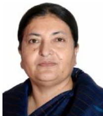
राष्ट्रपति विधादेवी भण्डारी

जनालाई तत्काल उद्धार एवम् राहतका लागि आग्रह गर्नुपर्ने । राष्ट्रपति कार्यालयबाट जारी विज्ञापितमा उल्लेख छ । साथै मुलुकको संबन्धील भौगोलिक अवस्थितिका कारण नदी प्रणालीलाई व्यवस्थित पारी प्राकृतिक प्रकोपको निराकरण गर्न सरकारले अत्यन्तै ध्यानकर्षण र दीर्घकालीन योजना बनाउनु पर्ने तर्फ ध्यानकर्षण गराएको राष्ट्रपति कार्यालयबाट जारी विज्ञापितमा उल्लेख छ ।