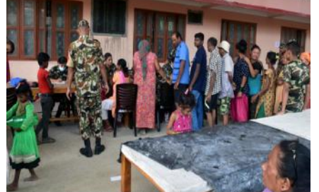
बाढीबाट प्रभावित स्थानीयहरूलाई स्वास्थ्य सेवा प्रदान गर्दै नेपाली सेना।