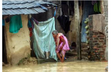
बाढीमा डुबानमा परेका सामानहरू ओसार पसार गर्दै वृद्ध।