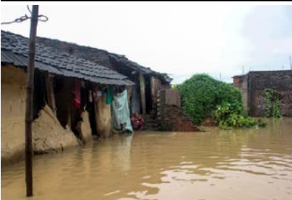
वर्षाका कारण आएको बाढीमा डुबेका घरबार।