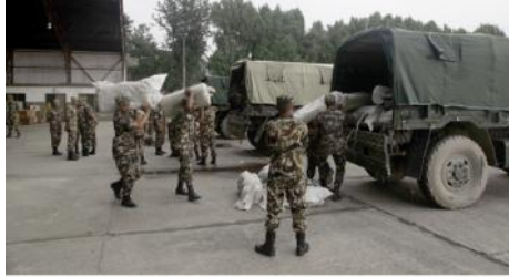
भिन्न अर्न्तगत विमानस्थल, पैदल ब्योक्स्ट बढी प्रभावित स्थानहरू बाघ साम्री तथा अन्य राहत सामग्रीहरू हल्लिँदा लै गरी पठाउँदै।