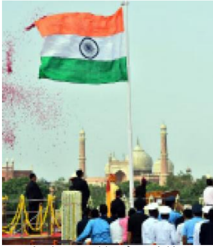
स्वतन्त्रता दिवसको अवसरमा भण्डोतोलन गर्दै प्रधानमन्त्री मोदी ।

नयाँ दिल्ली (भारत) । भारतले ७१औं स्वतन्त्रता दिवस मनाएको छ । भारतको ७१ औं स्वतन्त्रता दिवसको अवसरमा नयाँ दिल्लीको लाल किल्लामा भारतीय प्रधानमन्त्री नरेन्द्र मोदीले सम्बोधन गरेका छन् । उनले 'गोली र गाली' बाट कश्मीरको समस्या समाधान नहुने बताएका छन् । उनले पृथकतावादीहरूले कश्मीरमा 'पड्डयन्त्र रचिरहेको' बताए । प्रधानमन्त्रीले धर्मका नाममा हिंसा गराउने कतिपय समूहलाई सम्बोधनमा कटाक्ष गरे । उनले भने, जातिवाद र साम्प्रदायिक हिंसा मच्चाउनु राष्ट्रको उत्थानमा समस्या हुने बताए । उनले मिलेर कश्मीरमा देखिएका समस्याको समाधान गर्नुपर्ने पनि बताए । तर आरोप वा हतियारको भरमा समस्या समाधान नहुने बताउँदै कश्मीरको समस्याको पहिचान गर्न सम्बद्ध सबैको इमान्दार प्रयास चाहिने उनको भनाई थियो । कश्मीरिहरूसँग मिलेर उक्त स्थानलाई पुनः स्वर्ग जस्तै बनाउनुपर्नेमा प्रधानमन्त्रीले जोड दिए । मुसलमान समुदायको वसोवास रहेको कश्मीरमा भारत र पाकिस्तानबीच दशकौंदेखि कायम सीमा विवादको केन्द्रमा रहँदै आएको छ । पाकिस्तानले आफ्नो स्वतन्त्रता दिवस १४ अगस्तमा मनाउने गर्छ । पाकिस्तानले स्वतन्त्रता दिवस मनाएको भोलिपल्ट भारतले भव्य कार्यक्रमसहित आफ्नो स्वतन्त्रता दिवस मनाएको हो । मोदीले उत्तरी भारतमा अक्सिजनको अभावमा ज्यान गुमाएका ६० बालबालिकाको मृत्युको विषयमा बोल्दै देशलाई उनीहरूका परिवारको पीडामा एकताबद्ध हुन पनि अपील गरे । उनको सम्बोधनलाई भारतीय सञ्चारमाध्यमले प्रत्यक्ष प्रसारण गरेका थिए । सम्बोधनस्थलमा पनि ठूलो भीड स्वतन्त्रता दिवस मनाउने सहभागी बनेको थियो ।