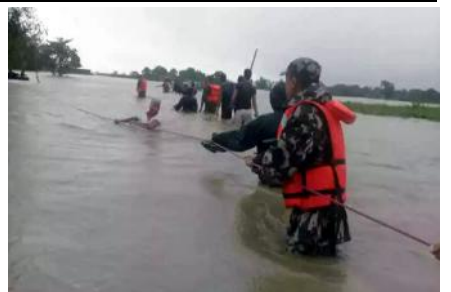
डुबानमा परेका सर्वसाधारणहरूलाई सुरक्षित स्थानतर्फ लैजाँदै।