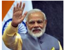
भारतीय प्रधानमन्त्री नरेन्द्र मोदी