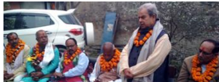
कार्यक्रमलाई सम्बोधन गर्दै राजपा संयोजक महन्थ ठाकुर ।

जयेश्वर । राष्ट्रिय जनता पार्टी नेपालका संयोजक महन्थ ठाकुरले स्थानीय चुनाव भइसकेपछि पनि सिंहदरबार गाउँ-गाउँमा आएको बताएका छन् । उनले यहाँ हुनुपर्ने अधिकारहरू सिंहदरवारले अर्को पनि कब्जा गरी बसेको बताएका हुन् । उनले भने, 'वर्तमान संविधानमा यतिजति बुद्धिहरू रहेका छन् कि त्यसले त्यसलाई नसच्याईकन जताले यो संविधानमा आफ्नो अधिकार पाउन सक्नेछन् ।' उनले आफूहरू अहिले पनि संविधान संशोधनको मुद्दालाई नछोडे बताउँदै यो संविधान संशोधन नभइकन पूर्णरूपमा कुनै पनि हालतमा लागू हुन नसक्ने ठोक्का गरे । 'संविधान संशोधन गरिएन भने जसले यो संविधान बनाएका छन् उनीहरूद्वारा नै यो संविधान छस्य हुनेछ', ठाकुरले भने । उनले यो संविधान बनाउनेहरू आफैँले नै विभिन्न जटिलताका कारण संविधान कार्यान्वयन गर्न नसकेर समाप्त पार्ने खतरा रहेको संकेत गर्दै ठाकुरले थप संघर्षका लागि तयार रहनुपर्ने बताए ।