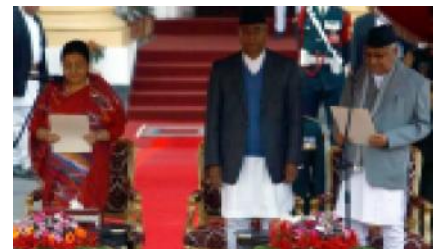
राष्ट्रपति कार्यवाहमा शपथ ग्रहण गर्दै नवनिर्वात प्रधानमन्त्री केपी शर्मा ओली ।

मधेशवाणी डेस्क काठमाडौं, २०७२ असोज २४ गते पहिलो पटक प्रधानमन्त्री बनेका नेकपा एमालेका अध्यक्ष केपी शर्मा ओलीले सत्ता सहायलेको ६ महिना पछि २०७२ चैत ३० गते देशवासीको नाममा दोस्रो सम्बोधन गर्दै मधेश आन्दोलन अर्कै पनि पुष्टि हुन नसकेको टिप्पणी गरेका थिए, जतिबेला मधेशी दलहरू संविधान संशोधनको माग गर्दै आन्दोलनमा थिए ।