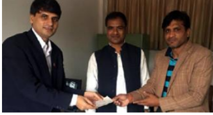
पुष्प पछि अतिमृतकलाई माया गरिएको छ। पुष्प गरे भने यस्ता उदाहरण देखा सकिन्छ। अहिले पनि म विवरत छु कि अवालले भुलाइले हरावा जाट किसानमा मा फाँसि तुरुक परिवारलाई आफ्नो अधिकार प्रयोग गर्नेमैका दिव्य भई तरल अतिम फैसला गर्ने आँखि उठि अवाल हो। यहि कारण अवालको फैसला नआए सम्म तिम लाललाई मुनिसित पनि समाजिक अन्यायक पछि परराष्ट्रलाई बुझाएको रकम बारे रोचो राख्नु अहिले पाकिस्तान आए फेरि रिडित परिवारलाई अवालको फैसला सम प्रस्तावा गर्ने फेरि सफल हुन्छ। रिडित परिवारले देखाएको मानवतालाई हामी सबैले सलाम उठ्ने पर्छ। पहिला पनि पाकिस्तानमा यस्तै एउटा अर्को घटना भई सकेको छ, बढी मेडियाबन्दी भएको थियो रकम बँडेर कोठामा पुगेको थियो। यहि कारण थियो, रकम सलाम को मेडियाबन्दी गरिकोट पढेने बनेको थियो। आजको दिन नेपालबाट पठाएको नेरु तिम लख पाकिस्तानमा रहेको नेपाल दुतावासको खातामा सुरक्षित रहेको छ जनजातिका दुतावासको तिम लख उठ्ने शिमा भई पछि रिडित परिवार विज्या मानवान्द्र र बढी रहेको सार्क दुई वला बिकस बर्ष लगायत अन्य बर्षमा प्रयोग गरिनेछ।