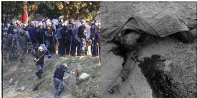
मलेठ घटनाको दृश्य । सुरक्षाकर्मीहरू (बायाँ) र गोली लागी मृत्यु भएका प्रदर्शनकारी (दायाँ) । फाइल फोटो ।

मधेशवाणी डेस्क काठमाडौं । पंच जनाको ज्यान जानेगरी मल्परि जिल्लाको मलेठमा भएको घटनाको मुख्य दोषी लत्कावीन एमाले र मधेशी मोर्चा रहेको निष्कर्ष उच्चस्तरीय छानविन समितिको प्रतिवेदनले देखाएको छ ।