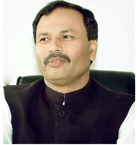
अनिलकुमार भन्ना नेता, राष्ट्रिय जनता पार्टी नेपाल