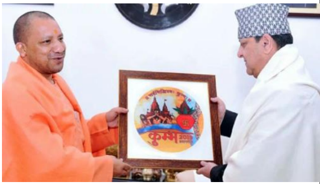
पूर्वराजा ज्ञानेन्द्र शाहलाई उत्तर प्रदेशका मुख्यमन्त्री योगी आदित्यनाथ 'कुम्भ लोपो' प्रदान गर्दै।

काठमाडौं। पूर्वराजा ज्ञानेन्द्र शाहले भारतको लखनऊ पुगेर उत्तर प्रदेशका मुख्यमन्त्री योगी आदित्यनाथलाई भेटेका छन्। भेटका क्रममा मुख्यमन्त्री आदित्यनाथले उपहारस्वरूप पूर्वराजा ज्ञानेन्द्रलाई अंग बस्त्र र कुम्भको लोपो प्रदान गरेका छन्। पूर्वराजा ज्ञानेन्द्र अघिल्लो सातादेखि सपरिवार मध्य तथा सुदूरपश्चिमका जिल्लाहरूको भ्रमणमा निस्किएका थिए। यसक्रममा केही दिन नेपालगञ्जमा रहेका पूर्वराजाले सोमवार लखनऊ पुगेर आदित्यनाथसँग भेट गरेका हुन्। लखनऊस्थित आफ्नो सरकारी आवासमा नेपालका पूर्व नरेश ज्ञानेन्द्र, शाहसँग भेट भएको भन्दै मुख्यमन्त्री आदित्यनाथले तस्वीरहरू टवीट गरेका छन्। आदित्यनाथले भेटमा अंग बस्त्र एवं कुम्भको लोपोका साथ भेट भएको बताएका छन्। अंगबस्त्र भनेको अंशमा लगाउने सुगालाई बुनिएको। तस्वीरमा आदित्यनाथले पूर्वराजा ज्ञानेन्द्रलाई सेतो रंगको दोसल्ला ओढाएको देखिन्छ। हिन्दु मान्यता अनुसार यस्तो अंगबस्त्र दान गर्नाले दातालाई आफूमाथि पनि दुःख कष्ट नपार्न हुन्छ र शुभ शान्ति मिन्छ भन्ने मान्यता छ। आधुनिक समाजमा पनि खादा वा दोसल्ला