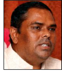
फोरम अध्यक्ष उपेन्द्र यादव

मधेशवाणी डेस्क काठमाडौं । वाम गठबन्धनका तर्फबाट एक सातार्थि प्रधानमन्त्री बनेका एमाले अध्यक्ष केपी ओलीले सरकारमा मधेशी दललाई सहभागी गराउने विषयमा पहल सुरु गरेका छन् । प्रधानमन्त्रीको पहलमा संघीय समाजवादी फोरमले सरकारमा सहभागी हुने ‘गिन सिमल’ देखाएको छ भने अर्को मधेशी दल राष्ट्रिय जनता पार्टी नेपाल पनि तयार भएको छ । सत्तारूढ नेकपा एमालेसंगको पटक पटकको वार्ता र छलफल पछि अन्ततः फोरम नेपालले प्रधानमन्त्री केपी शर्मा ओली नेतृत्वको वाम गठबन्धन सरकारमा सहभागी हुने तयार भएको हो ।