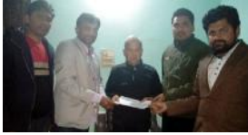
राजपा संयोजक महन्थ ठाकुरलाई ज्ञापनपत्र बुझाउँदै ।