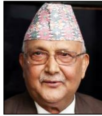
प्रधानमन्त्री केपी शर्मा ओली