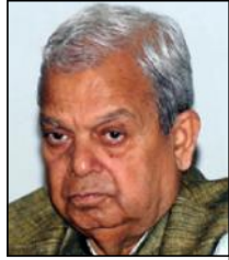
राजपा संयोजक महन्थ ठाकुर