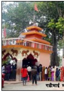
गढीमाई मन्दिर, बारा

स्थल हो। वाराको गढीमाई मन्दिर धार्मिक पर्यटनका लागि महत्वपूर्ण देवस्थल हो। यहाँको रत्नपुर जंगल प्रमुख पर्यटकीय स्थल हो। रौतहटका शिवनगर मन्दिर, बडेवाताल, राजदेवी मन्दिर सुन्दर पर्यटकीय स्थलहरू हुन्। सर्लाहीका सागरनाथ, धावधाम, हरिहर महादेव पनि प्रमुख पर्यटकीय स्थल हुन्। उता महोत्तरीको जलेश्वरनाथ महादेव यस क्षेत्रकै प्रमुख धार्मिक स्थल हो। जलेश्वरनाथ महादेवस्थललाई मिथिलाको प्रवेशद्वार मानिन्छ। बानेश्वरनाथ महादेव वावा, पडौलको कारिक वावा, कञ्चनचौर, धुबकुण्ड, गिरिजास्थान, मालिवारा, माईस्थान, सिद्धिनाथ मन्दिर, सोनामाई स्थान, टुट्टेश्वरनाथ महादेव, रौजा मजार, मंगलनाथ महादेव, माटोहानी आदि