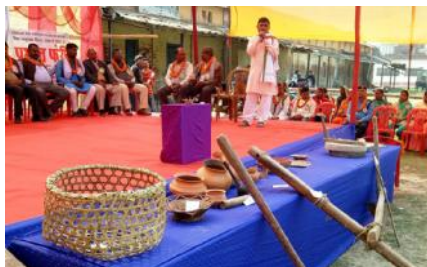
बज्जिका भाषा विकास समारोहमा लोपोन्मुख सामग्रीहरू।

राकेश यादव, रौतहट। रौतहटमा विभिन्न कार्यक्रम आयोजना गरी विश्व मातृभाषा दिवस मनाइएको छ। मातृभाषा दिवसको अवसरमा गर्व से कहूँ बज्जिका भाषी छौँ बज्जिका भाषा विकास हमनी के प्रतिबद्धता मूल नाराको साथ ग्रामीण शिक्षा विकास नेपाल रौतहटले आयोजना गरेको बज्जिका भाषा विकास समारोह २०७४ भव्यताको साथ सम्पन्न भएको छ।