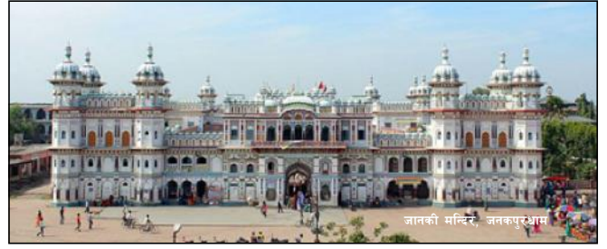
जानकी मन्दिर, जनकपुरधाम

पोखरी, देवान पोखरी, डवरा पोखरी, पापमोचनीसर, पुष्पधन सर, बाल्मीकि सर, भुतही पोखरी, मुरलीसर, रामसागर, लक्ष्मणसर, सीताकुण्ड, सूर्यकुण्ड, विषहरा पोखरी, महाराज सागर, रूकमिणी सर, पावती सर, विडाल सरजस्ता धार्मिक स्थल