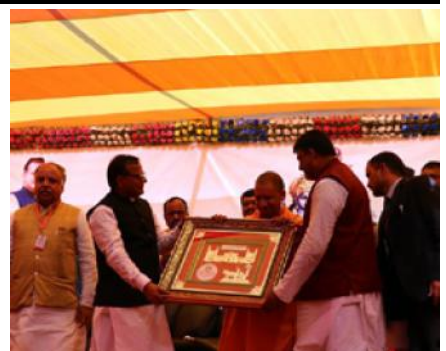
मायाको चिनोस्वरूप जानकी मन्दिरको तस्वीर प्रदान गर्दै ।