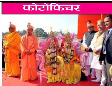
विवाह महोत्सवमा सामूहिक तस्वीर खिचाउँदै ।