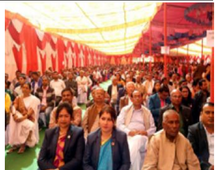
कार्यक्रममा उपस्थिति विभिन्न राजनीतिक दलका नेता कार्यकर्ता तथा जुद्धजीवीहरू ।