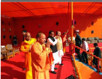
कार्यक्रममा अभिवादन गर्दै मुख्यमन्त्री योगी ।