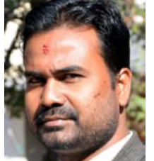
राजमार्ग आठ लेनको बनाउनुपर्ने, बारा अन्तर्गत विमानस्थल, काठमाडौँ-तराई गरी फास्ट ट्याक लगायत राष्ट्रिय गौरवका योजना बनाउन सरकार, राजनीतिक दल तथा तिनका नेतालाई दबाव दिने संयोजक

साहले बताए । मधेशमा पर्यटनको विकासका लागि मञ्चले लुम्बिनी-गौरीगढ-सिमीगढ-जन्कपुर जोड्ने गरी रेलमार्ग निर्माण हुनुपर्ने माग अघि सारेको छ । यसैगरी रस्मील-वीरगन्ज-काठमाडौँ तथा पूर्व पहिचान रेलमार्ग निर्माण छिटो हुनुपर्ने माग मञ्चमा आबद्ध युवाहरूले गरेका छन् । मधेशका राष्ट्रिय वनजङ्गल मासेर निर्माण गरिएका भौतिक संरचना हटाउनुपर्ने, हरेरौ मधेश निर्माणका लागि एउटा बडै योजनाका रूपमा पनि अभियान शुरू गर्नुपर्ने माग सरकारसँग गर्दै मञ्चले चुनसंस्थापन गर्न आग्रह गरेको छ । मञ्चले मधेशका प्रत्येक स्थानीय तहका प्रत्येक वडामा अत्याधुनिक पुस्तकालय स्थापना गर्नुका साथै शिक्षा, स्वास्थ्य, कानून, इन्जिनियरिग, कृषि, लगायतका शिक्षाका लागि आर्थिक एवं उच्च शिक्षाको व्यवस्था गर्नुपर्ने