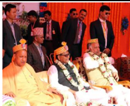
अभिनन्दन कार्यक्रममा सहभागी मुख्यमन्त्री योगी ।