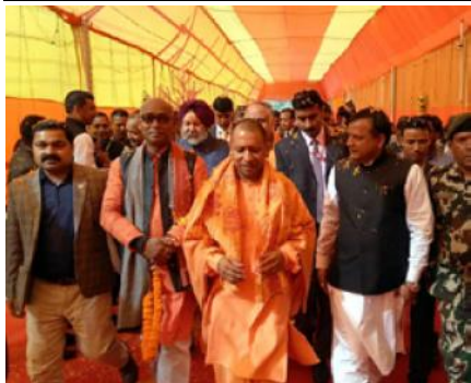
विवाह महोत्सव कार्यक्रमस्थलतर्फ प्रस्थान गर्दै मुख्यमन्त्री योगी ।