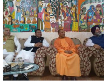
मुख्यमन्त्रीद्वय योगी र राउतसहित भेटवार्तामा ।