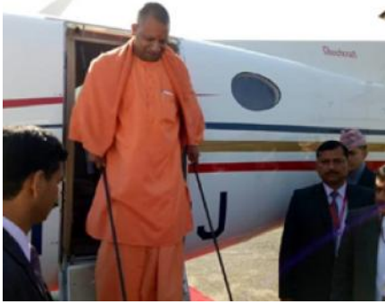
विशेष विमानबाट जोरिदै युपीका मुख्यमन्त्री योगी आदित्यनाथ ।