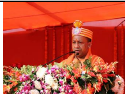
विवाह महोत्सवको शुभकामना मन्तव्य व्यक्त गर्दै मुख्यमन्त्री योगी ।