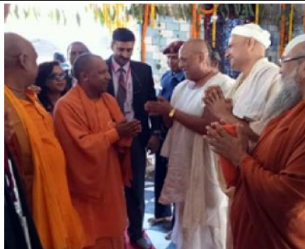
जानकी मन्दिरका महन्चलगायतका साधुसन्तसँग भेटघाट गर्दै मुख्यमन्त्री योगी ।