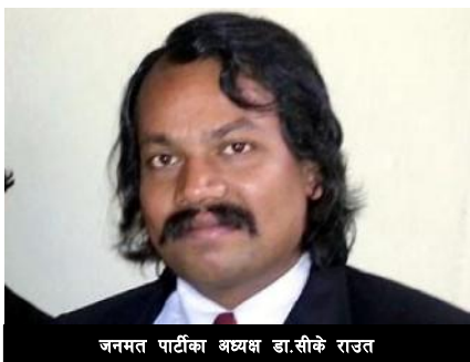
जनमत पार्टीका अध्यक्ष डा.सीके राउत

काठमाडौं। सरकारसँग ११ बुंदे सहमति गरेर मूलधारको राजनीतमा आएका डा सीके राउतले आफ्नो नेतृत्वमा रहेको स्वतन्त्र मधेश गठबन्धनलाई नाम फेरि 'जनमत पार्टी' राखेका छन्।