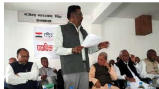
राजपा पदाधिकारी बैठकमा अध्यक्षमण्डलका सदस्यसहित अन्य नेतागण ।

मधेशवाणी डेस्क काठमाडौं । राष्ट्रिय जनता पार्टी नेपाल यतिबेर अर्धसंस्कृतको अवस्थामा छ । फुट र जुटको राजनीतिबाट अर्ध बडेका विभिन्न मधेशी दलहरू मिलेर बनेको राजपा अहिलेसम्म सुदृढ हुन सकेको छैन । २०७५ वैशाख ७ गते पार्टी एकता गरेको राजपा भित्र दुई वर्गभित्रै घरम निराशा छाएको छ । पार्टी एकता गर्दा कार्यकर्ताको जाँट उल्लाह थियो, अहिले निराशागत उन्मुख भइरहेको छ । पार्टीभित्रको असन्तुष्टिलाई चिने परिपक्व नेतृत्व प्रदान गर्ने नसक्दा राजपा अहिले रूमाएको छ । कार्यकर्ताबीच भा र यादवलाई नेतृत्व दिने विषयमा पार्टी भित्र नयाँ विवाद देखिएको छ । पार्टीकै केही असन्तुष्ट पक्षले पार्टी नै परिवर्तन गरी भिन्न मोर्चाबन्दी गरे पनि त्यसबाट उसले पाउ सिकन सकेको छैन । पार्टीको स्पष्ट कार्यदिशालाई स्थापित गर्न नसक्दा राजपा आफैँ रूमाएको स्वयं नेताहरू बताउँछन् । त्यसैले नेता कार्यकर्तामा अहिले नसन्ध पैदा भएको छ । गाउँ, बडा र जिल्ला तहदेखि केन्द्रीयस्तरमा नेता कार्यकर्ताबीच राम्रो तालमेल छैन । पार्टीको एकताको महाधिवेशन घोषणा गरे पनि त्यसलाई विभिन्न बहानामा लम्ब्याउने चालवाजी भइरहेको छ ।