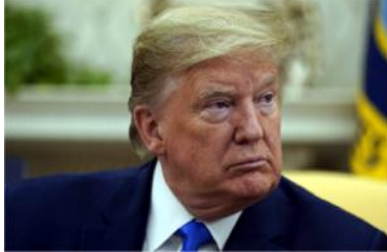
त्यसको जवाफमा ट्रम्पले भने, 'छ उनले चीनले कोरोना भाइरस फैलाउने मसँग। मैले देखेको छु।'

एजेन्सी। अमेरिकी राष्ट्रपति डोनाल्ड ट्रम्पले चीनको ल्याबबाट कोरोना भाइरस फैलिएको प्रमाण आफूसँग रहेको बताएका छन्। पत्रकार सम्मेलनमा उनले आफूले त्यो कुरा प्रत्यक्ष देखेको दाबीसमेत गरे।