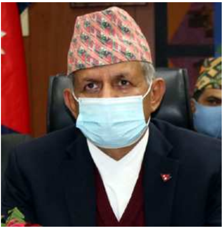
परराष्ट्रमन्त्री प्रदीप कुमार जवाली