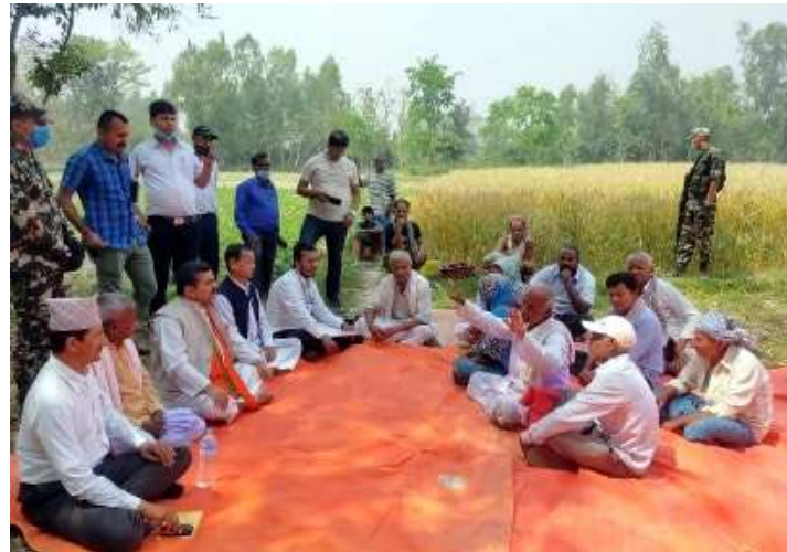
किसानसँग भलाकुसारी गर्दै प्रदेश प्रमुख डा.अहिराज ।