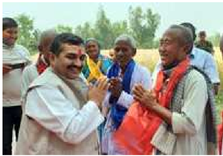
सिरहाको गोलबजार नजिक गुरुधाम गाउँका तरकारी किसानसँग खेतमै सम्बाद । किसानका पीडा सुन्नुका साथै सम्मानसमेत गर्दै ।