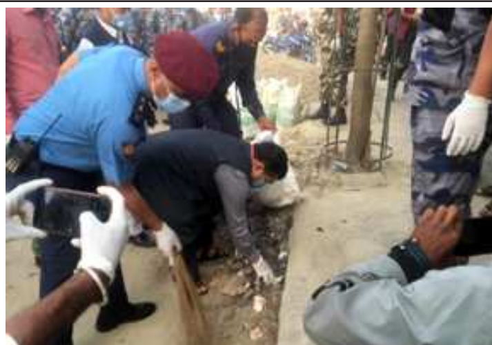
जनकपुरको पिडारी चोकमा सरसफाई गर्दै । युवा विकास संस्थाको पहल र प्रमुखको सक्रियतामा कुनामा थुपिएको फोहोर सफाई गर्दै