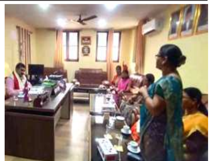
प्रदेश २ को सरकारमा महिला सहभागिताको माग गर्दै अन्तरपार्टी महिला सञ्जाल प्रदेश प्रमुख डा.अहिराजलाई ज्ञापनपत्र बुझाउँदै ।