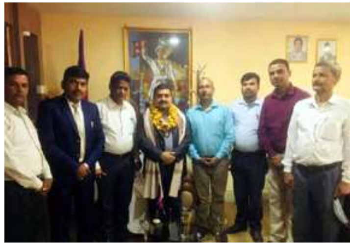
नन-प्याक्सनका टीमसँग छलफलपश्चात् सामूहिक तस्वीर । नन-प्याक्सनले प्रदेश प्रमुख अहिराजलाई स्वागतसमेत गरेको थियो ।