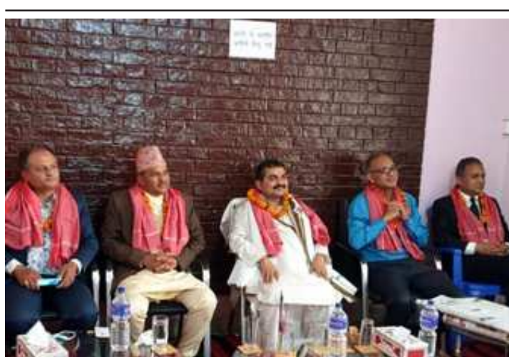
बैंकर्सहरूसँग छलफल गर्दै प्रदेश प्रमुख डा.अहिराज ।