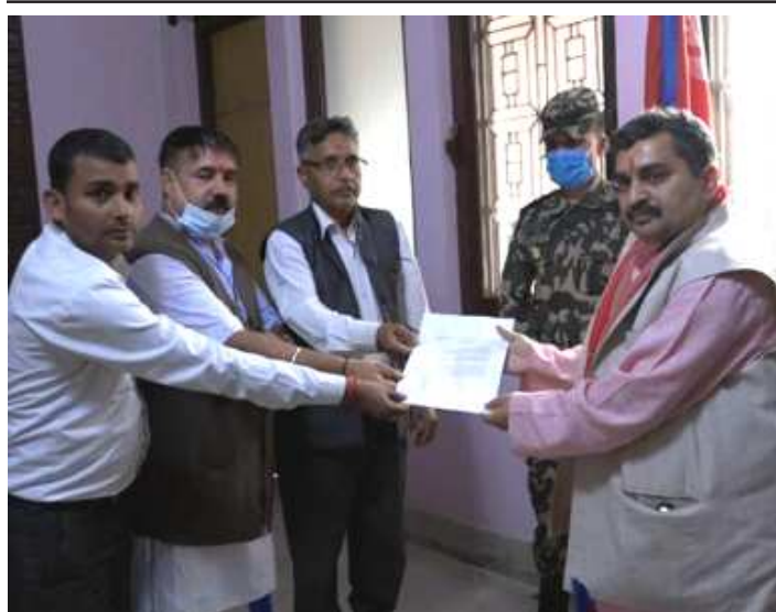
महोत्तरीको पिपरा गाउँपालिकास्थित सहोडवा गाउँबाट अपहरित भ्ना दम्पतिको खोजबिनका लागि नागरिक अगुवाहरूको ज्ञापनपत्र बुझ्दै ।