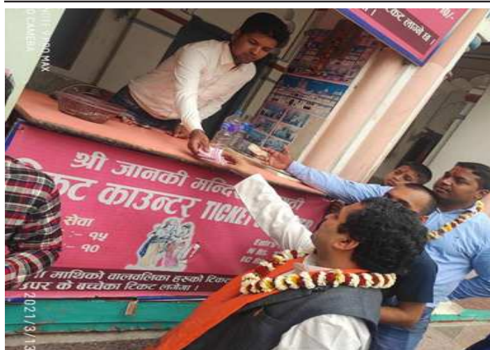
फागुन २९ गते शनिबार जानकी मन्दिर म्युजियमको अवलोकन तथा भ्रमणका लागि टिकट खरिद गर्दै प्रदेश प्रमुख डा.अहिराज ।