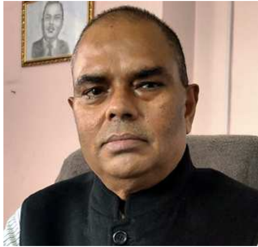
जसपा अध्यक्ष उपेन्द्र यादव

२२, दलित ९, अपांग ५ र पीछडिएको क्षेत्रका लागि ४ प्रतिशत कोटा छुट्याउनुपर्ने कानूनी व्यवस्था छ। जसपाको केन्द्रमा कानून अनुसार कुनै पनि क्वटरको प्रतिनिधित्व छैन। भण्डे ७० वर्षको जनक्रान्तिपछि बनेको संबिधानका मुख्य चार 'पिलर' हुन्, गणतन्त्र, समावेशीता, धर्मनिरपेक्षता र समावेशी।