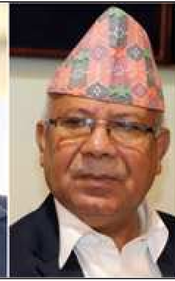
माधव कुमार नेपाल