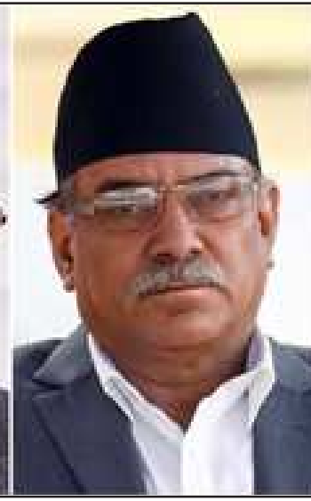
पुष्पकमल दाहाल 'प्रचण्ड'