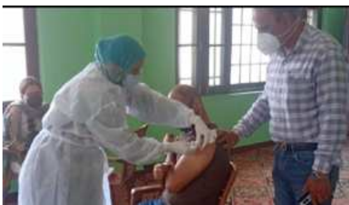
जनालाई दोस्रो खुराक दिइएको छ ।

केन्द्रीय स्वास्थ्यमन्त्री मनसुख मण्डवीयले बुधबार जानकारी दिए अनुसार राष्ट्रव्यापी कोभिड-१९ खोप अभियानको महत्वपूर्ण उपलब्धि स्वरूप पहिलो पटक भारतमा एक मात्रा खोप लगाएका भन्दा पूर्ण खोप लगाएका को संख्या बढी रहेको छ । उनले भने, " पहिलो पटक भारतमा एक मात्रा खोप लगाएका भन्दा पूर्ण खोप लगाएका को संख्या बढी रहेको छ ।"