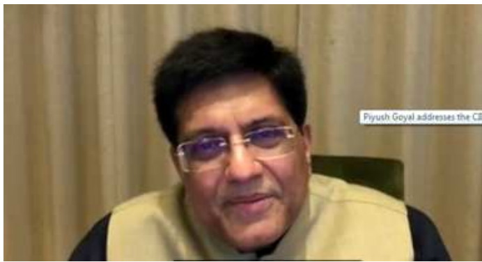
Piyush Goyal addresses the CE

काठमाडौं । हालैको सीआईआई-अर्नस्ट र यंग लेखलाई उल्लेख गर्दै भारतको केन्द्रीय वाणिज्य र उद्योगमन्त्री पियुस गोयलले मंगलबार भविष्यमा भारत विश्वव्यापी लगानीको केन्द्र बन्ने बताएका छन् ।