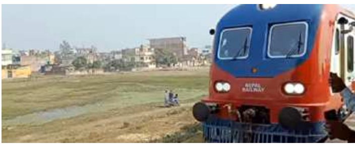
जनाइएको छ । इनर्वा स्टेशनमा राखिएको रेल जनकपुरधाम हुँदै कर्थासम्म पुगेको छ । कर्थाबाट पुनः रेल घुमाएर जनकपुरधामसम्म

जनकपुरधाम । लामो समयदेखि घुम्टोमा रहेको रेलको शनिवार परीक्षण गरिएको छ । भारतबाट ल्याएदेखि नै रेललाई त्रिपालले छोपेर राखिएको थियो । भारतबाट १४ जनाको प्राविधिक टोली बोलाएर रेलको परीक्षण गरिएको हो । घनुषाको इनर्वास्थित रेल्वे स्टेशनमा १६ महिनादेखि थन्क्याइएको रेल परीक्षणका लागि गुडाइएको छ । २०७७ असोज २ गते जनकपुर ल्याइएको रेल ३ गतेदेखि इनर्वा स्टेशनमा पार्किङ गरी राखिएको छ । लामो समयसम्म पार्किङ गरेर राखिएका कारण रेलको पार्टपुर्जाको अवस्थाबारे बुझ्न परीक्षण