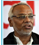
राजेन्द्र महतो अध्यक्ष राष्ट्रिय मुक्ति पार्टी नेपाल

मधेशवाणी साप्ताहिक २१औं वर्ष प्रवेश गरेकोमा मधेशवाणी परिवारलाई र २०८२ नव वर्षको अवसरमा सम्पूर्ण नेपालीजनमा सुख, शान्ति एवं समृद्धिका लागि हार्दिक शुभकामना व्यक्त गर्दछु ।