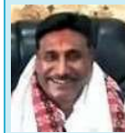
शरतसिंह मण्डारी मन्त्री श्रम, रोजगार तथा सामाजिक सुरक्षा मन्त्रालय

मधेशवाणी साप्ताहिक २१औं वर्ष प्रवेश गरेकोमा मधेशवाणी परिवारलाई र २०८२ नव वर्षको अवसरमा सम्पूर्ण नेपालीजनमा सुख, शान्ति एवं समृद्धिका लागि हार्दिक शुभकामना व्यक्त गर्दछु ।