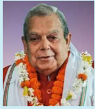
महन्ध ठाकुर अध्यक्ष लोकतांत्रिक समाजवादी पार्टी नेपाल

मधेशवाणी साप्ताहिक २१औं वर्ष प्रवेश गरेकोमा मधेशवाणी परिवारलाई र २०८२ नव वर्षको अवसरमा सम्पूर्ण नेपालीजनमा सुख, शान्ति एवं समृद्धिका लागि हार्दिक शुभकामना व्यक्त गर्दछु ।