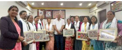
राष्ट्रिय सभाको उपाध्यक्ष विमला धिमिरेसहित सात वटै प्रदेशका उपसभामुखहरूलाई मधेश भवनस्थित मुख्यमन्त्री कार्यालयमा स्वागत तथा सम्मानप्रस्ताव सामूहिक तवर्यी ।

जनकपुरधाम । मधेश प्रदेशका मुख्यमन्त्री सतिशकुमार सिंहले राष्ट्रिय सभाका उपाध्यक्ष विमला धिमिरेसहित सात वटै प्रदेशका उपसभामुखहरूलाई आफ्नो कार्यक्षेत्रमा स्वागत तथा सम्मान गरेका छन् । विहीवार साँझ मुख्यमन्त्री सिंहले उनीहरूलाई मुख्यमन्त्री तथा मान्यपरिषद्को कार्यलयमा खादा लगाएर स्वागत तथा सम्मान गरेका हुन् । उपसभामुखहरूको भूमिकाकायै थप प्रभावकारी र फराकिलो तुल्याउने उद्देश्यले विहीवार जनकपुरमा आयोजना गरिएको सम्मेलनमा उनीहरूले आ-आफ्नो अनुभव साटासाट गरेका हुन् । संसदीय अर्थसभा उपसभामुखहरूको भूमिका तथा नीतिगत सुधारका सवालहरूका विषयमा सात वटै प्रदेशका उपसभामुखहरूले आ-आफ्नो धारणा र