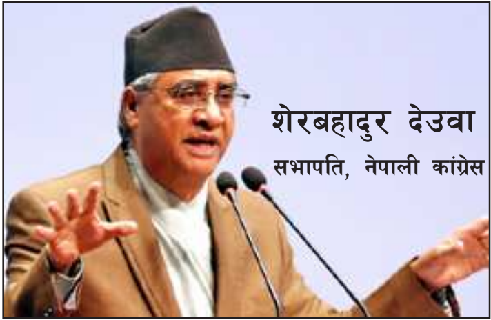
शेरबहादुर देउवा सभापति, नेपाली कांग्रेस