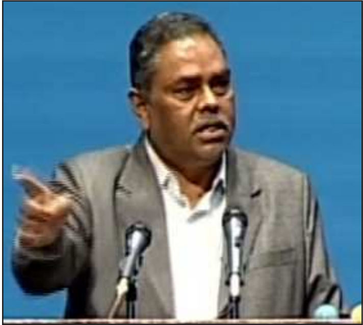
उपेन्द्र यादव अध्यक्ष, जसपा नेपाल

सम्माननीय सभामुख महोदय, सबभन्दा पहिला यो कोभिड-१९ महामारीबाट दिवंगत हुनुभएका नागरिकहरूप्रति हार्दिक श्रद्धाञ्जली र उनीहरूका परिवारजनप्रति समवेदना प्रकट गर्न चाहन्छु। अहिले हजारौं हजार नेपाली नागरिकहरू उपचारको अभावमा, वेडको अभावमा, औषधिको अभावमा छटपटाइ रहेका छन्। उनीहरूको समेत शीघ्र स्वास्थ्यलाभको कामना गर्दछु। डब्ल्युएचओले एक वर्ष अगाडि नै नेपाललाई चेतावनी दिएको थियो कि नेपालमा ठूलो खतरा आउदैछ र कोभिडको खतराको जोनमा छ। तर सरकारले बेवास्ता गर्‍यो। सरकारले गर्नुपर्ने तयारी केही पनि गरेन, जसको परिणाम आज अस्पतालमा वेड छैन, बरण्डामा सुतेका छन् मान्छेहरू। औषधिको अभावमा परिवारहरू रोएर छटपटाइरहेका छन्, विरामीहरू मरिरहेका छन्। यो घटना दिनहुँ भइरहेका छन्। यसरी सरकारले ध्यान दिनुपर्दथ्यो। कोरोना महामारीतर्फ सरकारको ध्यान नगइ अयोध्यतातिर गयो। चिन्तनमा अयोध्यता सरकारी ध्यान गयो। त्यसले कोरोना निको हुन्छ ? प्रचण्डजी खुशी हुनुहोला भनेको त उहाँ पनि दुःखै व्यक्त गर्नुभएको छ। सभामुख महोदय, जहाँसम्म सवाल छ कि यो तीन वर्षको। समझदारी त यो प्रधानमन्त्रीले